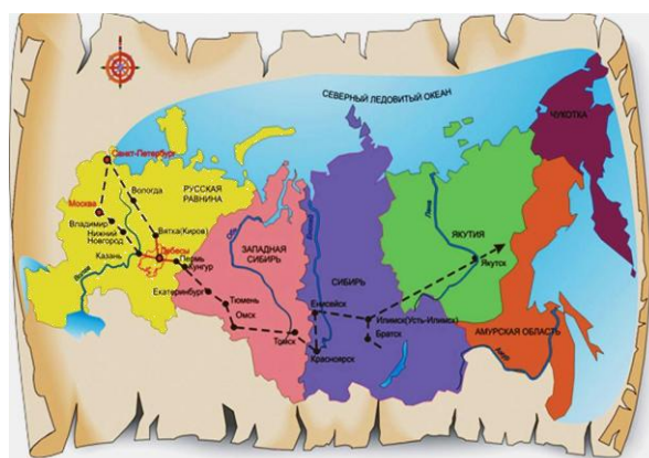
Карта Сибирского тракта

2. В 1730 году началось возведение Сибирского тракта, строительство последних участков которого было закончено только в середине XIX века. Этот тракт стал самой протяжённой сухопутной дорогой в мире, вместе с тем это был самый короткий путь, связавший восточные окраины Российского государства с Москвой, а затем и Санкт-Петербургом. С течением времени дорога много раз меняла своё направление, но всегда проходила по территории Прикамья. Тракт представлял собой широкую накатанную